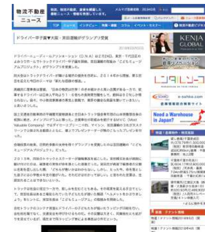
物流不動産ニュース