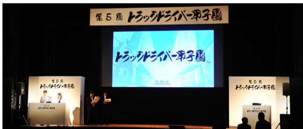
ステージレイアウト（大きさ・数は協賛社数に応じて対応）