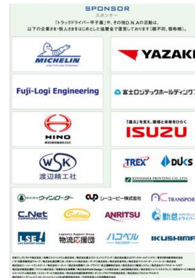
パンフレットでの 貴社ロゴ掲載