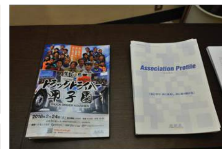
協賛企業様パンフレットを、 手提げ袋に導入して、 サンプリングいたします。