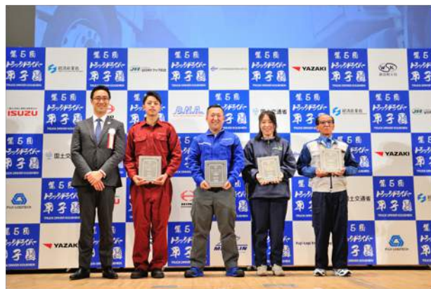
バックパネルに貴社ロゴを明記 (シルバースポンサー以上)