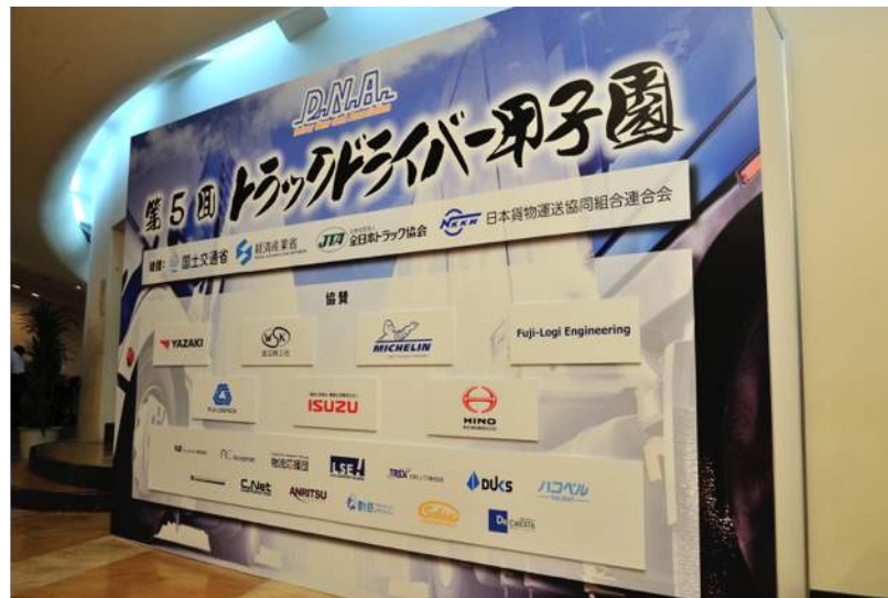
協賛社パネル（会場ホワイエ設置）